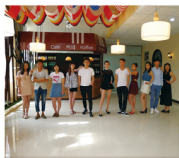
法国文化综合实训课——情景剧表演