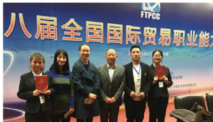
第八届全国国际贸易职业能力竞赛获得特等奖