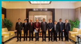
“一带一路”五国论坛峰会领导合影