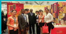
我校学生参加海味国际经贸技能大赛商品竞赛赛场

在校企合作方面，关务与外贸服务专业始终坚持专业对接产业，以培养服务“一带一路”人才为目标，推动育人质量上水平，提高教师实践教学水平，展现我校商科职业能力。在“十三五”及教育部《高等职业教育创新发展行动计划（2015-2018年）》期间，始终坚持专业对接产业，服务京津冀区域经济发展，先后与行业龙头企业合作，建设完成国家级“生产型”实训基地1个、国家级“双师型”培养基地1个、国家级协同创新中心1座、国家级“现代学徒制”试点专业1个。