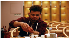
国际交流活动，旅游管理专业自 2016 年开始接受国际留学生

本专业致力于培养思想政治素质过硬、德技并修、德智体美劳全面发展，适应现代会展业发展和技术创新需要，具有良好的职业道德与服务意识、合作敬业的职业素质，掌握现代会展策划与管理基本知识，具备会展活动策划、营销、设计、服务与管理实际操作技术技能。本专业与天津国家会展中心、天津梅江会展中心、振威会展公司签署长期战略合作协议，主要面向会展策划助理、会展项目经理助理、会展营销员、会展物流员、会展客服专员、会展设计师、企事业单位会展专员等岗位，主要在会展组织策划服务公司、企事业单位参展、酒店等从事会展（会议、展览、节事活动、场馆、奖励旅游等）项目的市场调研、会展的立项、招商、招展、运营管理方案的策划设计、会展销售和会展现场服务、组织管理及实施工作的技术技能工作。