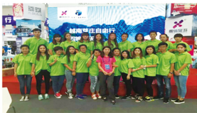
来自企业一线精英作为外聘教师，带领学生参与企业真实任务，现场教学