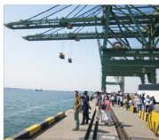
参观天津港集装箱码头