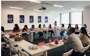
走访企业(鑫影华)与实习生座谈

财税大数据应用专业培养理想信念坚定,德智体美劳全面发展,具有一定的科学文化水平,良好的人文素养、职业道德和创新意识,精益求精的工匠精神,较强的就业能力和可持续发展能力;掌握本专业知识和技术技能,面向企事业单位、税务师机构和国家税务总局的税务专业人员职业群,能够从事税务会计、税务管理、税务服务、税务咨询、纳税筹划等工作的复合型技术技能人才。