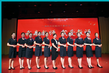
礼仪社团学生风采

专业现有专任教师全部拥有旅游相关行业工作经历并均已考取相关职业资格证书，兼职教师均来自旅游企业一线的行业精英，很多兼职教师都曾获得天津“金牌导游员”、全国“优秀导游员”等光荣称号，拥有丰富的实践经验，将企业需求与课程真正有效对接。