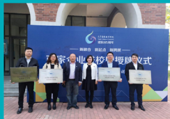
校外实训基地揭牌

学生参加全国 OCALE 跨境电商创新创业大赛、“海河工匠杯”电子商务职业技能大赛多次获得优异成绩