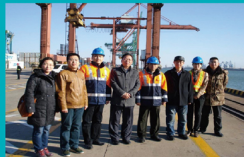
师生在天津津海河教育园区进行认识实习