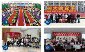
01 2018年全国职业院校技能大赛“电子商务技能”赛项现场

本专业致力于培养理想信念坚定,德、智、体、美、劳全面发展,实践动手能力强毕业生,同时,专业的毕业生也具有一定的科学文化水平,良好的人文素养、职业精神和创新意识,精益求精的工匠精神。专业紧跟电商行业的发展趋势,不断更新教学内容,校企结合紧密,实训条件丰富,着重培养学生的动手能力和问题解决能力,就业率高,职业发展前景广阔。