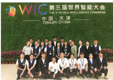
学生到智能大会进行实践