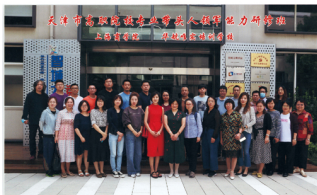
教师参加专业培训

本专业主要面向广告策划、广告设计、广告制作、广告营销等岗位,在各大广告设计公司、传媒公司、相关印刷、出版单位以及各类企业中从事广告设计、广告制作及广告发布等工作;利用电视、报社、网站、新媒体等宣传媒介从事广告设计工作;也能够从事企业、学校、科研单位、互动娱乐公司等从事广告制作、书籍和插图设计等相关工作。