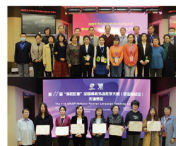
应用外语学院承办天津市高职院校职业技能大赛英语口语、外语教学大赛等赛项