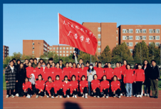
学生参加运动会取得优异成绩

本专业主要面向影视后期、剪辑包装与制作、商业影像拍摄、自媒体影像创作等岗位,主要在各大广告设计公司、传媒公司、互联网公司、电视媒体以及各类企业中从事影像内容生产、制作及发布等工作;也能够从事企业、学校、科研单位、互动娱乐公司等从事影像内容生产、制作及发布等相关工作。